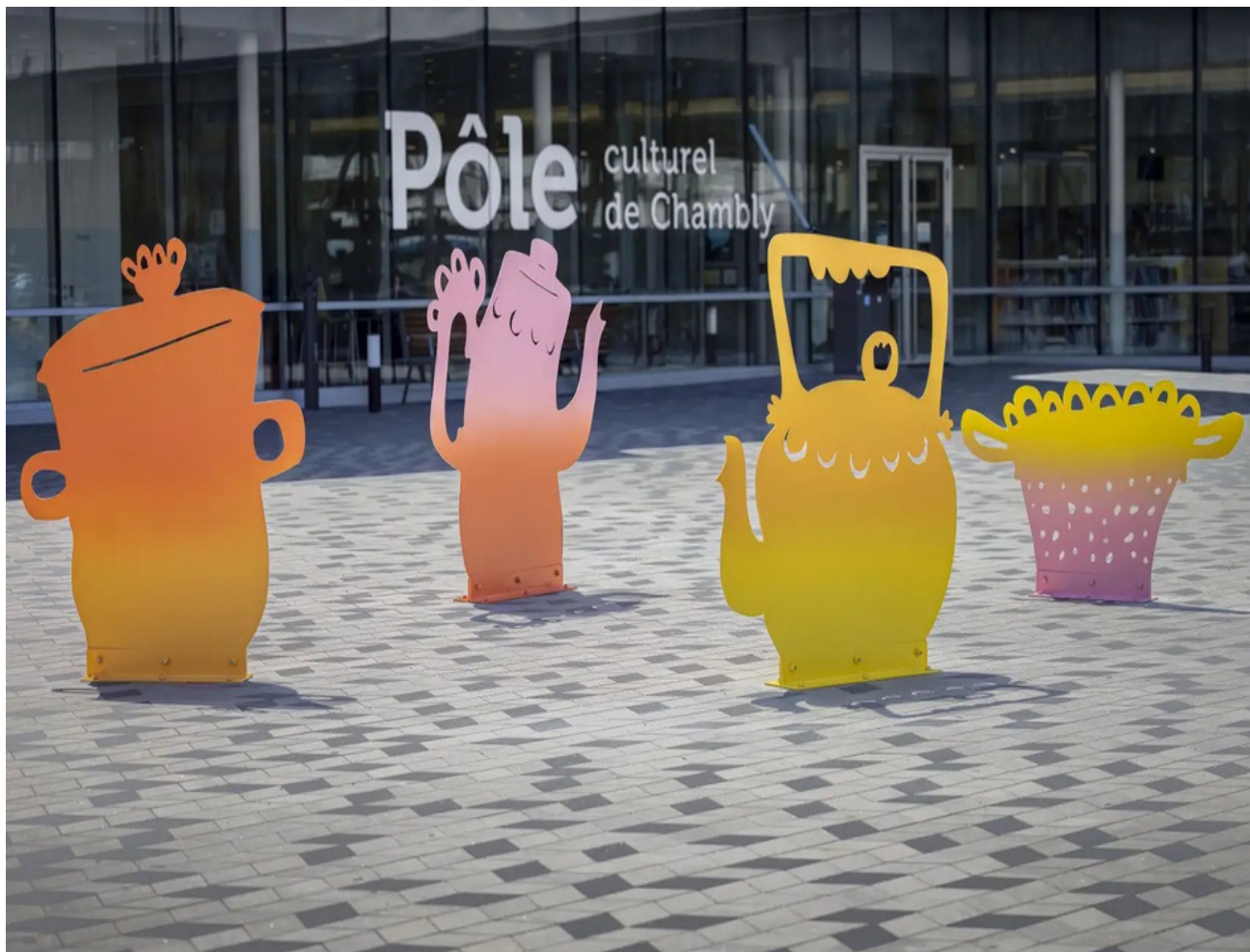
Le vaisselier public , œuvre d'art public de Geneviève Cadieux-Langlois installée sur l'esplanade du Pôle culturel de Chambly. L'artiste est la lauréate 2023 du prix relève Télé-Québec.

Nathalie Schneider Collaboration spéciale 20 mai 2023