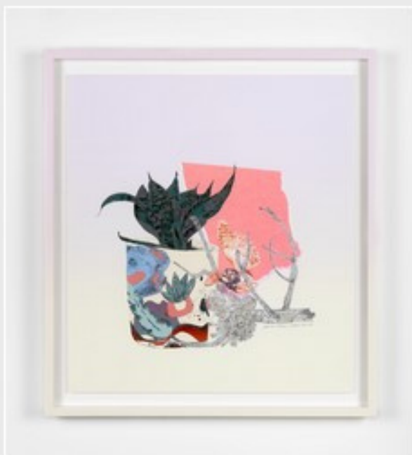
Une oeuvre de Geneviève Cadieux-Langlois.

Le Conseil des arts et des lettres du Québec, le ministère des Affaires municipales et de l'Habitation, la Ville de Longueuil et la Table de concertation régionale de la Montérégie, en collaboration avec Culture Montérégie, sont heureux d'annoncer un soutien de 236 000 $ à 8 artistes et 4 organismes artistiques sur le territoire des villes de l'agglomération de Longueuil dans le cadre du programme de partenariat territorial de la Montérégie.